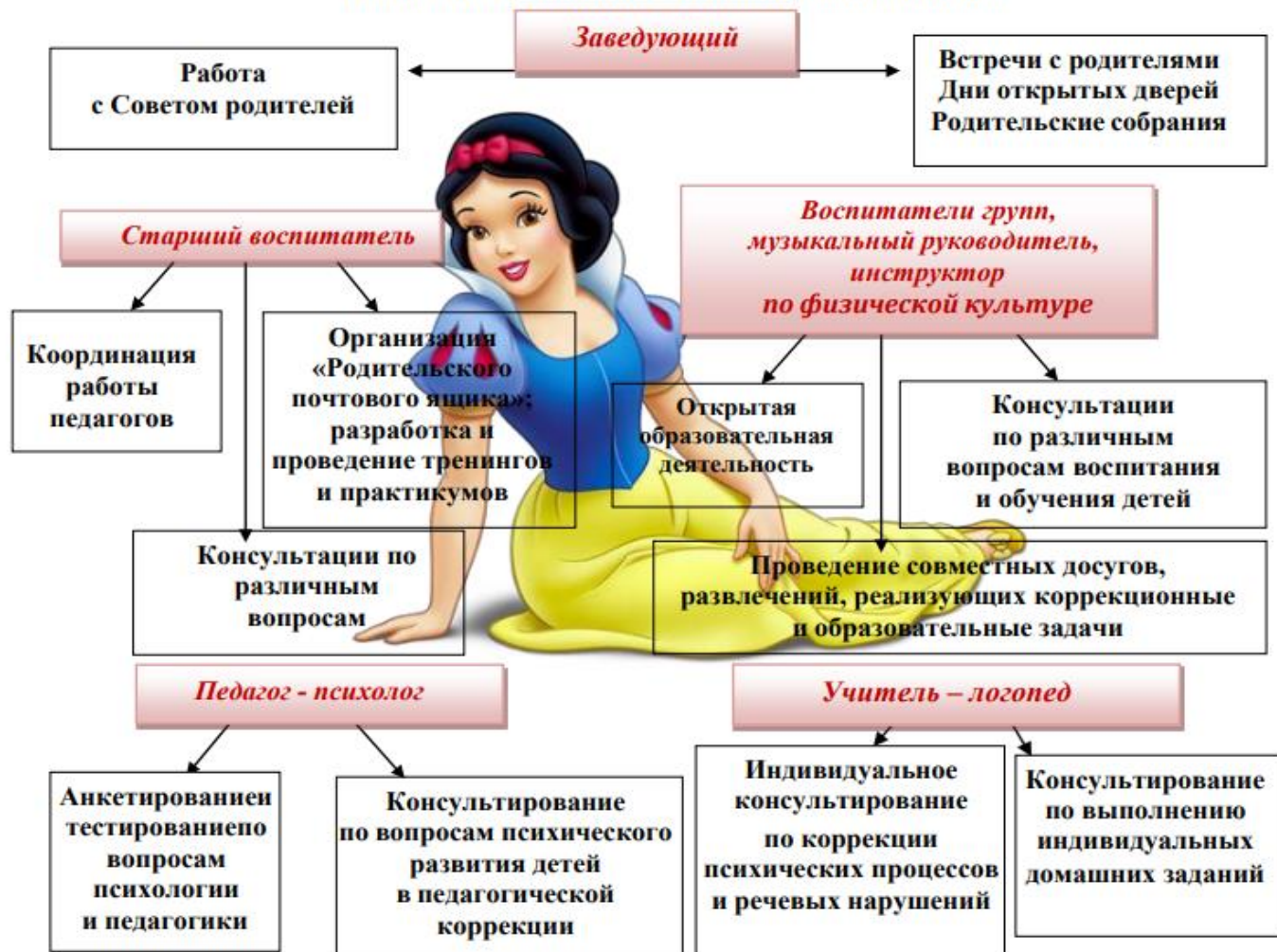
Схема взаимодействия с семьями воспитанников

Эта деятельность должна дополнять, поддерживать и тактично направлять воспитательные действия родителей (законных представителей) детей младенческого, раннего и дошкольного возрастов.